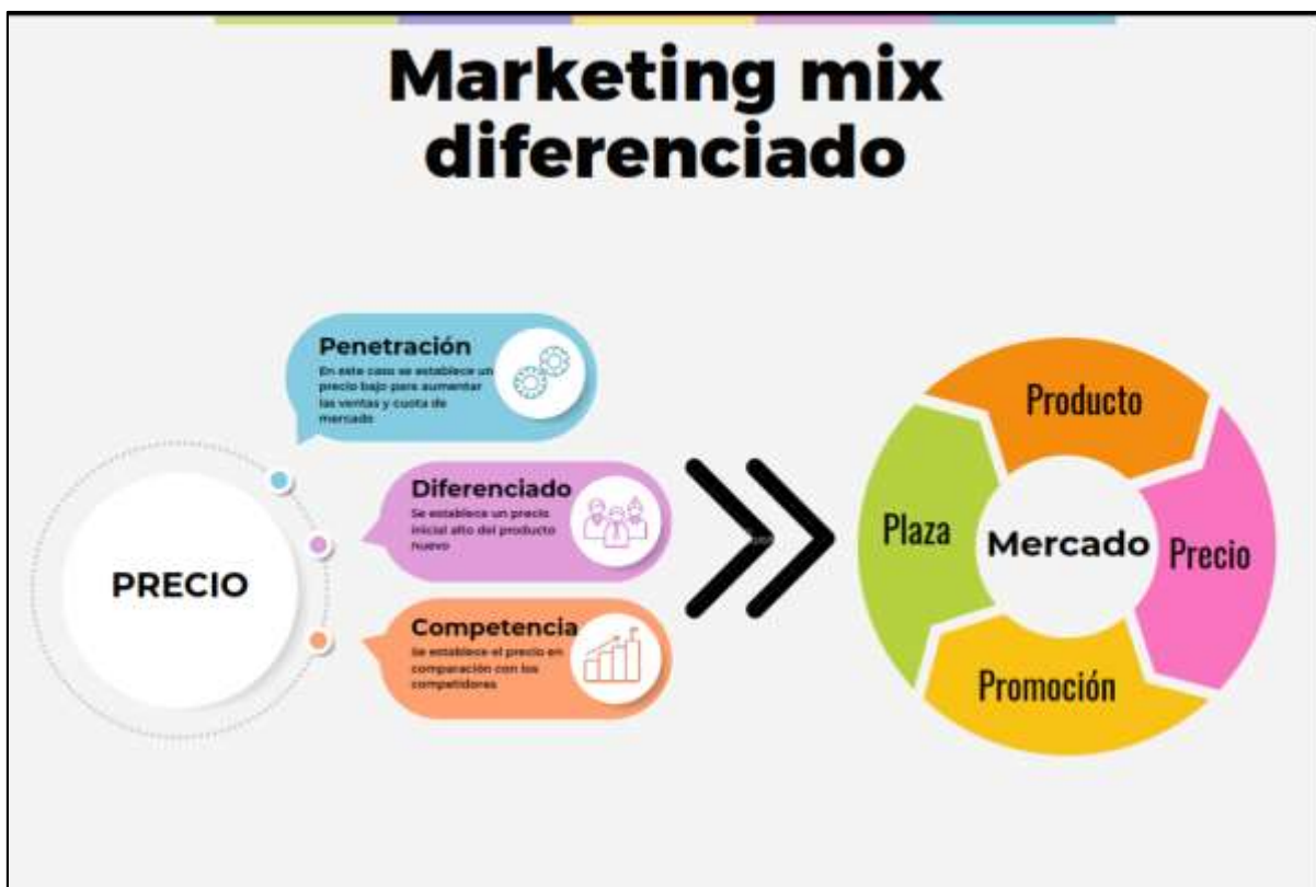
Figura 1. Modelo de marketing mix