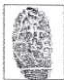
Firma del Autor