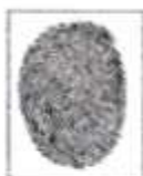
Firma del Autor