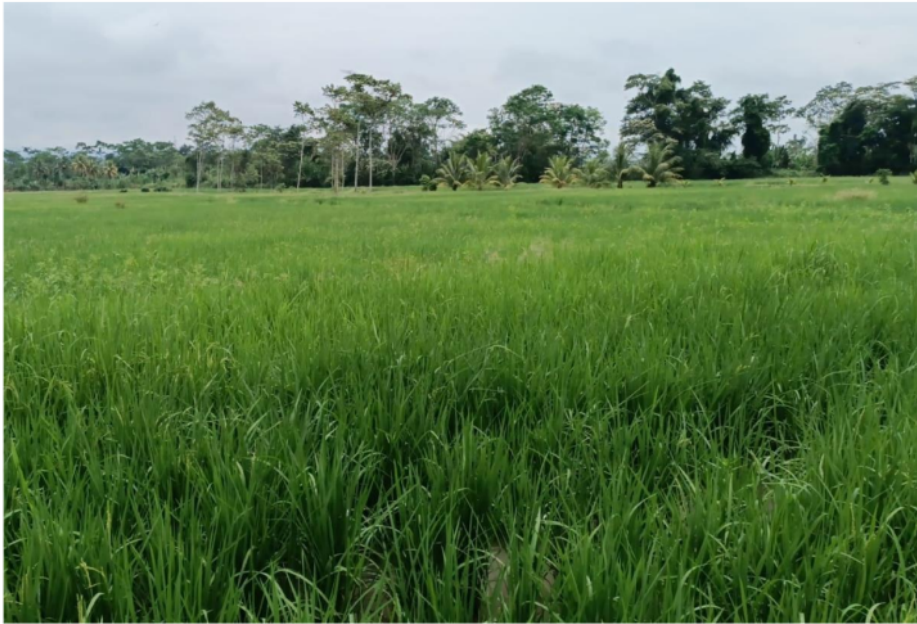
Anexo 8. Agroecosistema arrocero en el valle del Huallaga Central (Bellavista, San Rafael).