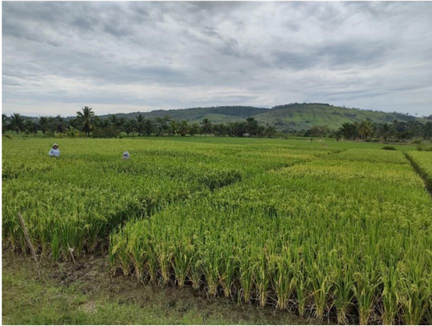
Anexo 6. Agroecosistema arrocero en el valle del Alto Mayo (Rioja, Yorongos).