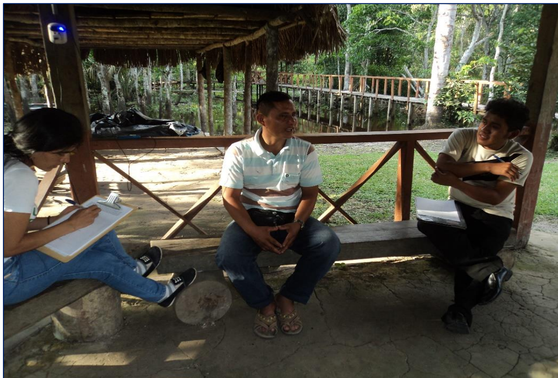
Fotografía 3: Realizando la entrevista al presidente de la asociación del sector Santa Elena.