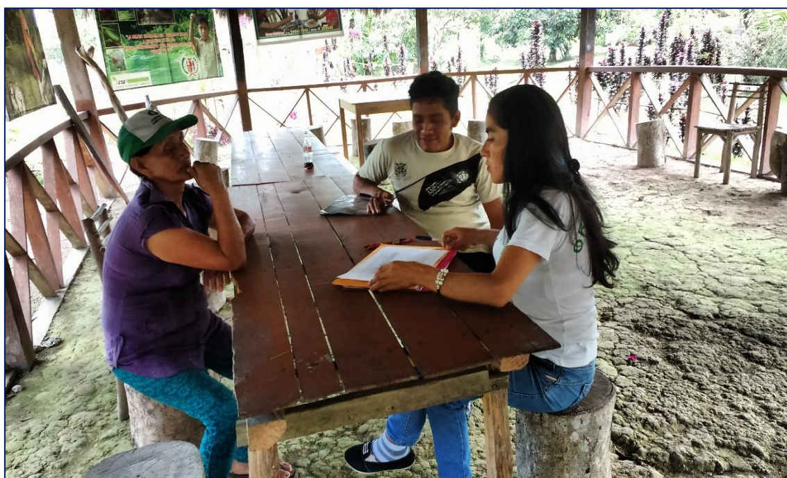
Fotografía 2: Realizando encuesta a los socios del sector Santa Elena.