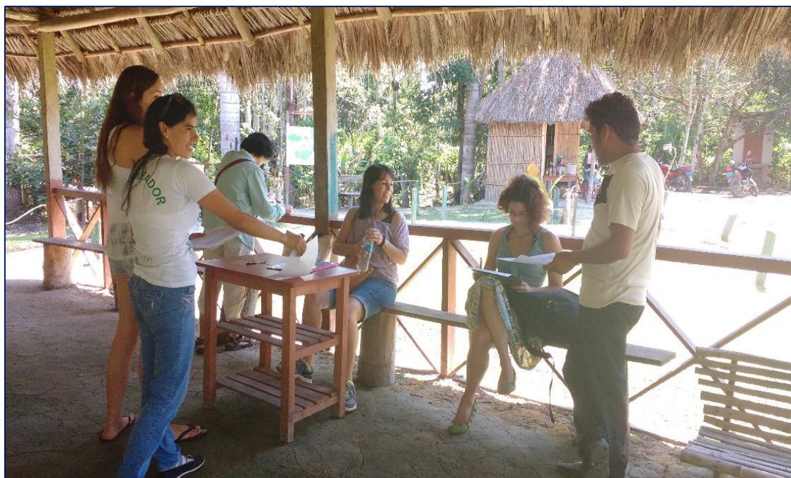
Fotografía 1: Realizando encuesta a Turistas.