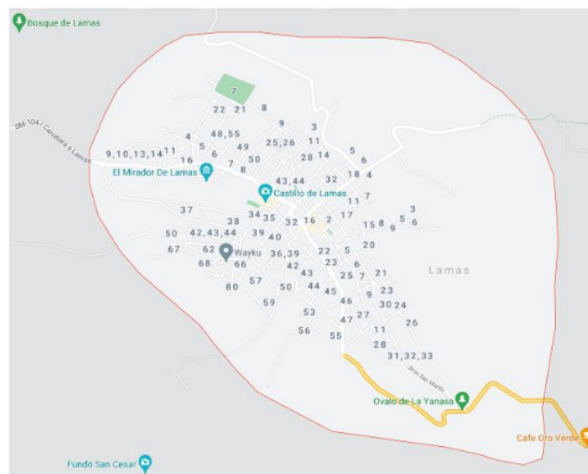
Figura 1. Localización de Lamas, San Martín, Perú.

Políticamente se seleccionó como ciudad de estudio el distrito de Lamas, cabecera de la provincia del mismo nombre (Lamas), en el departamento de San Martín. Limita con las provincias de Picota al sur, el departamento de Loreto al este, la provincia de San Martín al norte y El Dorado y Moyobamba al oeste.