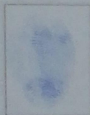
Firma del Autor