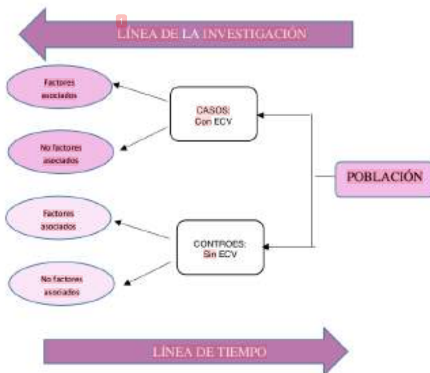
Figura 1 Diseño no experimental