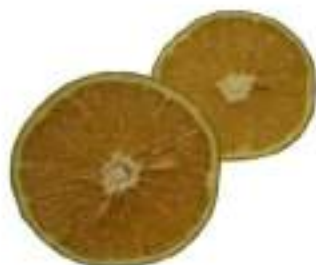
Figura 1 Fruto de Naranja

La Figura 1 muestra el fruto de naranja dulce procedente del género Citrus de la familia Rutáceas. Por su alto contenido en aceites esenciales y vitamina C, suele considerarse una de las frutas más populares. Se cree que esta planta se cultivó por primera vez en China y se introdujo en Europa hacia el siglo XV (Tucker et al., 1999).