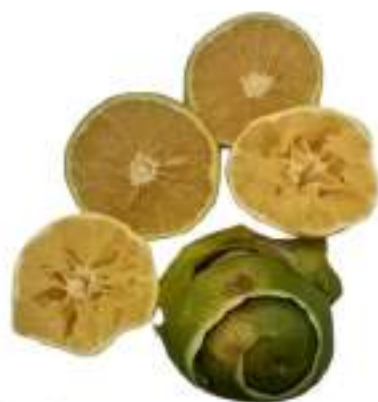
Figura 3 Residuos de Naranja