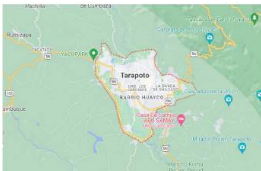
Figura 1 Ubicación geográfica del distrito de Tarapoto

La ciudad de Tarapoto se encuentra ubicada a una altitud de 342 m.s.n.m. y ocupa un área de 45 km 2 . Geográficamente, se encuentra situada en las coordenadas 06° 29' 16" latitud sur y 76° 21' 35" longitud oeste. Según datos del año 2021, este distrito alberga una población de 84,794 habitantes (Distrito, 2021).