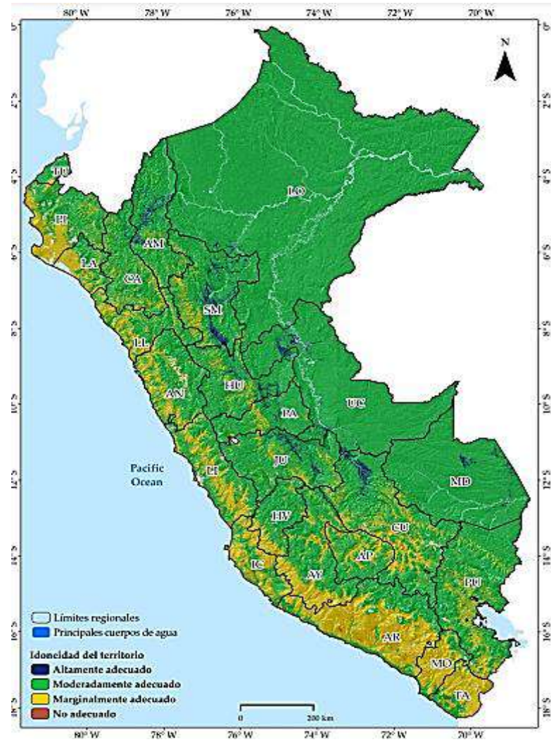
Figura 1 Gráfico de Territorio para el cultivo de cacao en Perú Nota: Rojas (2022, pag.35)